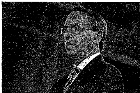
El subsecretario de Justicia Rod Rosenstein.

El proceso ocurre en momentos en que el fiscal especial Robert Mueller in-